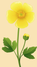
Un bouton d'or