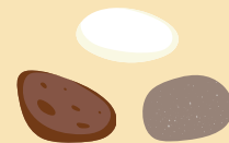
Trois cailloux de différentes couleurs