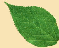
Une feuille verte