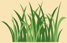
Un brin d'herbe