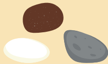
Trois cailloux de différentes couleurs