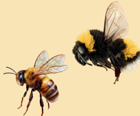
Une abeille ou un bourdon