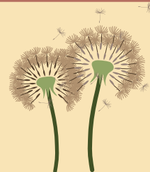
Deux pissenlits à souffler