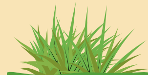
Un brin d'herbe