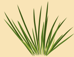
Un brin d'herbe