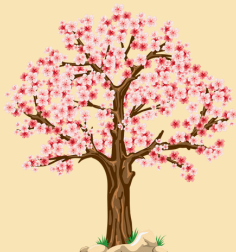
Un arbre en fleurs