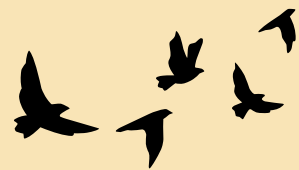
Un oiseau qui vole