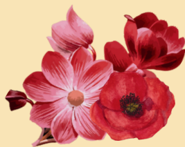
Une fleur rouge