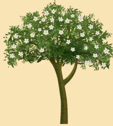
Un arbre en fleurs