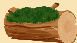
De la mousse