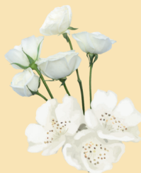
Des fleurs blanches